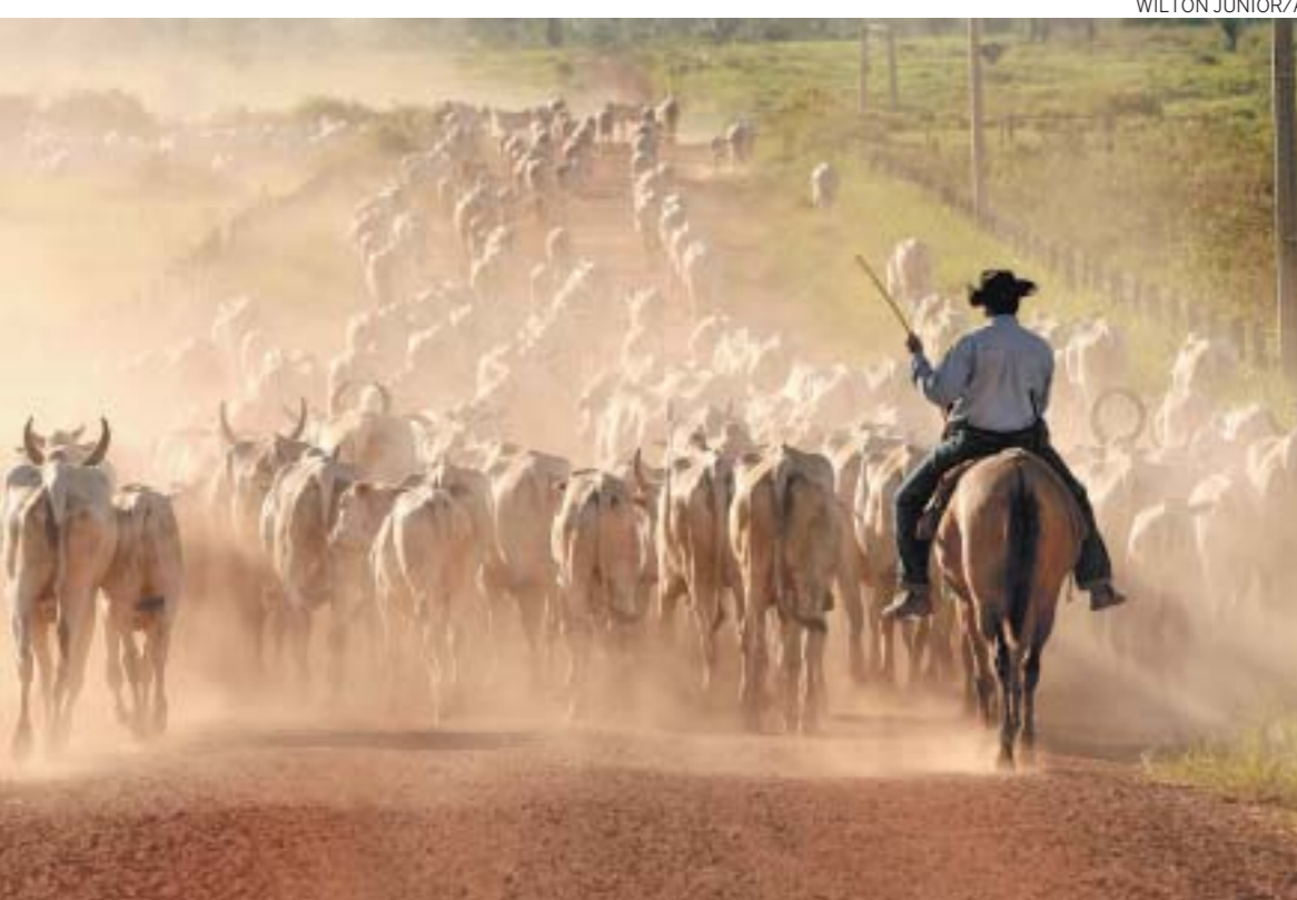
SATIAGRAHA - Justiça determina o sequestro do complexo de fazendas de Dantas: além da terra, os bois

Essa nova política criminal exige igualmente a atualização da legislação. Vários países adotaram regras específicas para o confisco do produto de crimes graves. Nos Estados Unidos e no Reino Unido, ilustrativamente, a lei deixa claro que a carga de prova exigida para o confisco é menor do que a exigida para a condenação criminal. Para esta última, é necessária prova acima de qualquer dúvida razoável, enquanto para o confisco basta demonstrar a prepon-