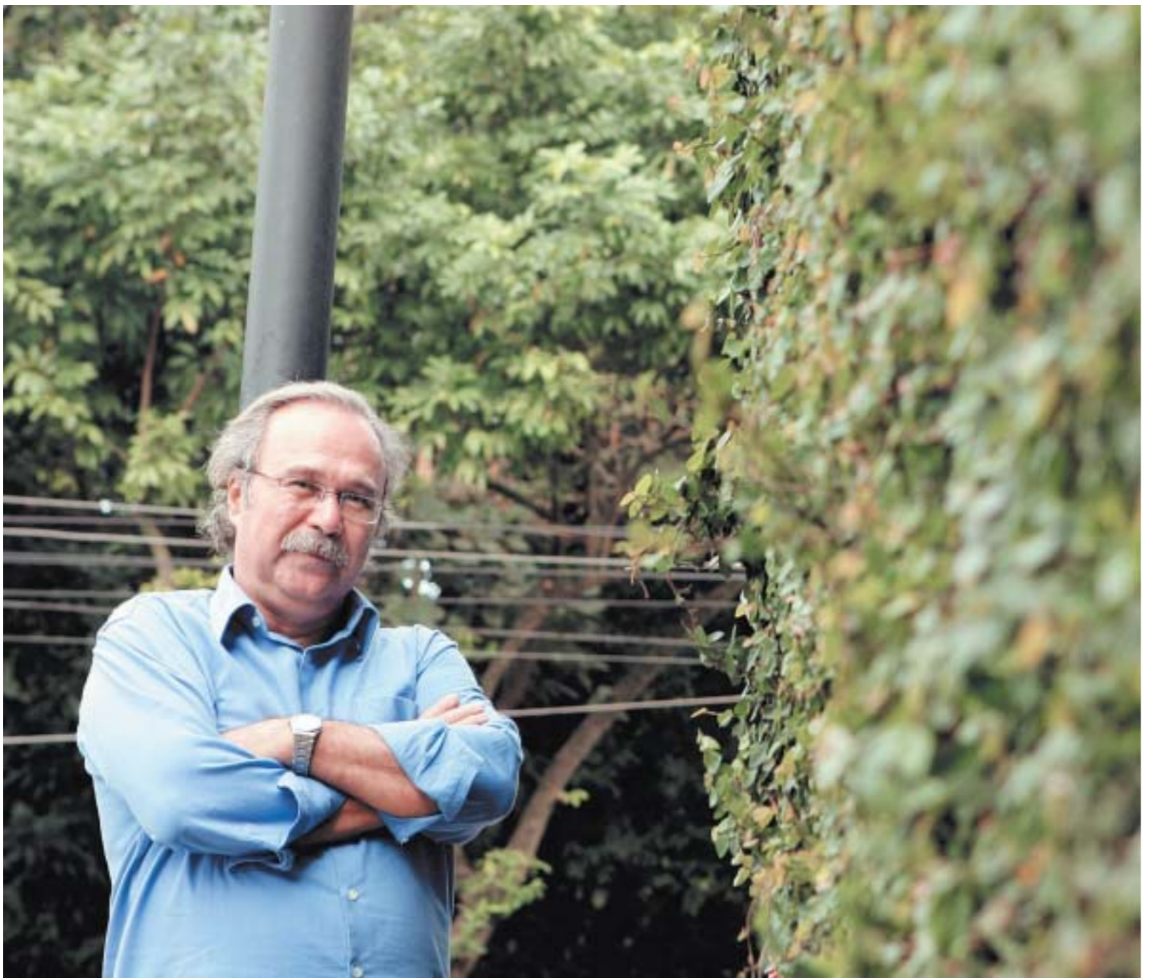
DOIS PESOS, DUAS MEDIDAS - 'O Estado brasileiro jogou recursos nas indústrias do Sul e deixou o Nordeste nas mãos dos coronéis'

Da civilização do açúcar esmiuçada por Gilberto Freyre à morte em que se morre de velhice antes dos 30 cantada por João Cabral de Melo Neto. Das vidas secas de Graciliano Ramos à geografia da fome de José de Castro. Da intervenção planejada de Celso Furtado no comando da Sudene à terra arrendo de Luiz Gonzaga. O que mudou no Nordeste? Muito, e quase nada. Com o Bolsa-Família, a fome diminuiu – e isso não é pouca coisa num quinhão de Brasil que concentra a metade dos acidentados pela insegurança alimentar grave. Por estes anos recentes tem até sobrado um dinheirinho para que a população finalmente entre no maravilhoso mundo do consumo. Estudo da FGV Projetos divulgado pelo Estado essa semana detectou aumento do número de casas com geladeiras, fogões, freezers, lavadoras e computadores em todos os Estados da região, entre 2001 e 2007.