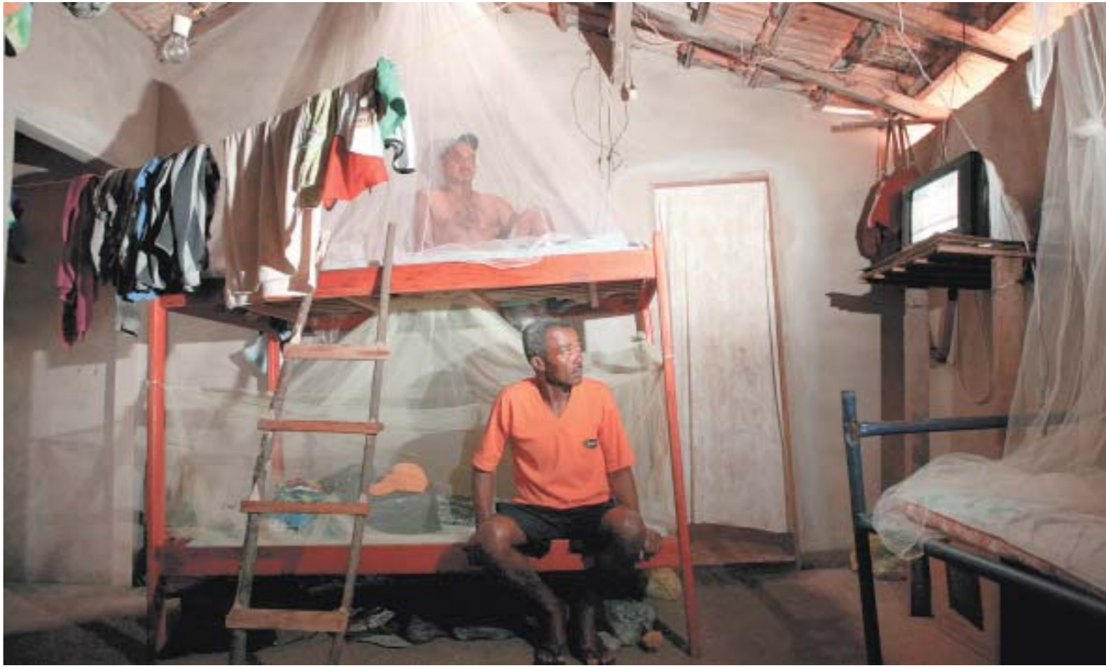
SERVIDÃO HERDADA - Em nossa 'terceira escravidão', a maioria dos trabalhadores libertados no Estado do Rio de Janeiro ainda é negra e mulata

Neste caso do Rio, 80 dos trabalhadores eram procedentes da Bahia. No conjunto dos casos que têm ocorrido no Brasil, o Nordeste é majoritariamente a região de recrutamento desses trabalhadores. Não é raro que